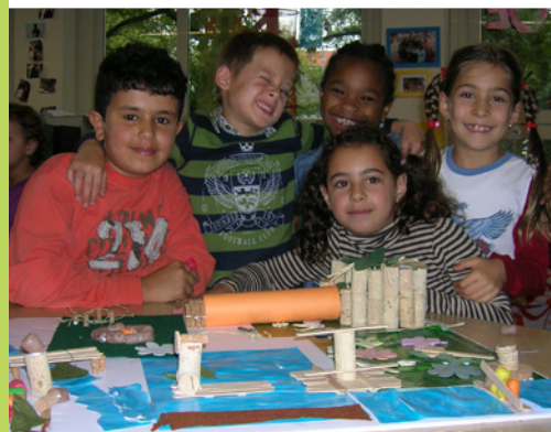
Natuurspeeltuin Sloterpark: festival Geuzenveld verandert!