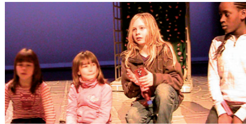
Jeugdonderzoekers in de bibliotheek

Zie voor meer informatie: www.oba.nl ; www.cc-educatie.nl