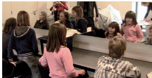
Jeugdonderzoekers in de bibliotheek

De medewerkers hebben genoten van het project: "Het is een andere manier van werken waardoor je veel meer contact met de kinderen op de afdeling hebt."