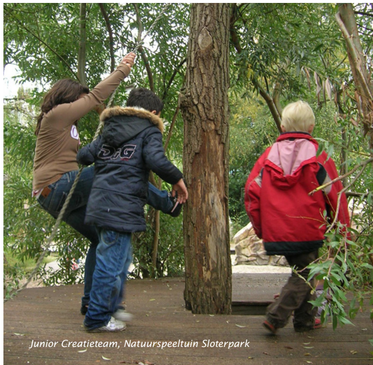
Junior Creatieteam, Natuurspeeltuin Sloterpark